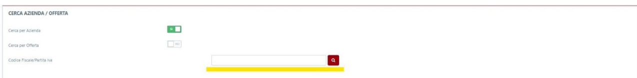
Fig. 4: Ricerca Codice Fiscale/Partita IVA Ente ospitante.

È possibile trovare nella homepage dei siti aziendali il Codice Fiscale o la P. Iva dell’Ente ospitante oppure cercarli direttamente dal sito dell’AgID ( https://indicepa.gov.it/ipa-portale/consultazione/indirizzo-sede/ricerca-ente ), inserendo solo l’acronimo dell’Ente e cliccando su “Ricerca” (riportiamo come esempio la Fig. 5, nella quale appare il risultato della ricerca se si scrive “ulss” nel campo “Denominazione/Acronimo Ente”).