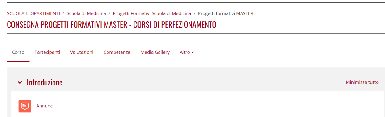
Fig. 8: Pagina di caricamento del Progetto Formativo.

Una volta reperite le firme necessarie, il Progetto Formativo va caricato nell'apposito Moodle, accessibile dalla pagina https://medicina.elearning.unipd.it/course/view.php?id=3107 e cliccando su "Continua". Se si sta effettuando il primo accesso a questa pagina Moodle, sarà necessario completare prima un'iscrizione spontanea cliccando sul pulsante "Iscrizione". Dunque, apparirà una schermata come in Fig. 8. Infine, cercando il proprio corso e cliccando su "Aggiungi consegna" potrete caricare il PDF del Progetto Formativo.