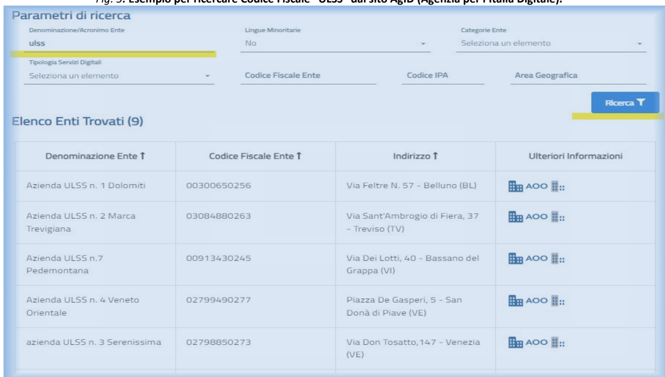
Fig. 5: Esempio per ricercare Codice Fiscale “ULSS” dal sito AgID (Agenzia per l’Italia Digitale).

È possibile trovare nella homepage dei siti aziendali il Codice Fiscale o la P. Iva dell’Ente ospitante oppure cercarli direttamente dal sito dell’AgID ( https://indicepa.gov.it/ipa-portale/consultazione/indirizzo-sede/ricerca-ente ), inserendo solo l’acronimo dell’Ente e cliccando su “Ricerca” (riportiamo come esempio la Fig. 5, nella quale appare il risultato della ricerca se si scrive “ulss” nel campo “Denominazione/Acronimo Ente”).