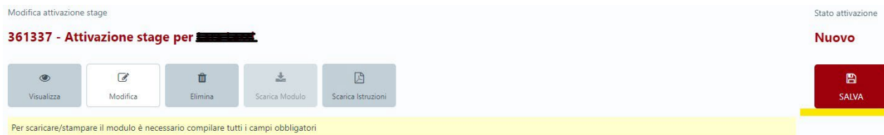
Fig. 7: Salvare la compilazione del Progetto Formativo.

Se saranno stati compilati tutti i campi, si potrà scaricare il modulo attraverso il pulsante "Scarica Modulo". Altrimenti, come si vede, sempre in Fig. 7, viene inibita la possibilità di cliccare sul pulsante e si riceve il messaggio evidenziato: "Per scaricare/stampare il modulo è necessario compilare tutti i campi obbligatori". In questo caso, cliccare sul pulsante "Modifica" e completare la compilazione.